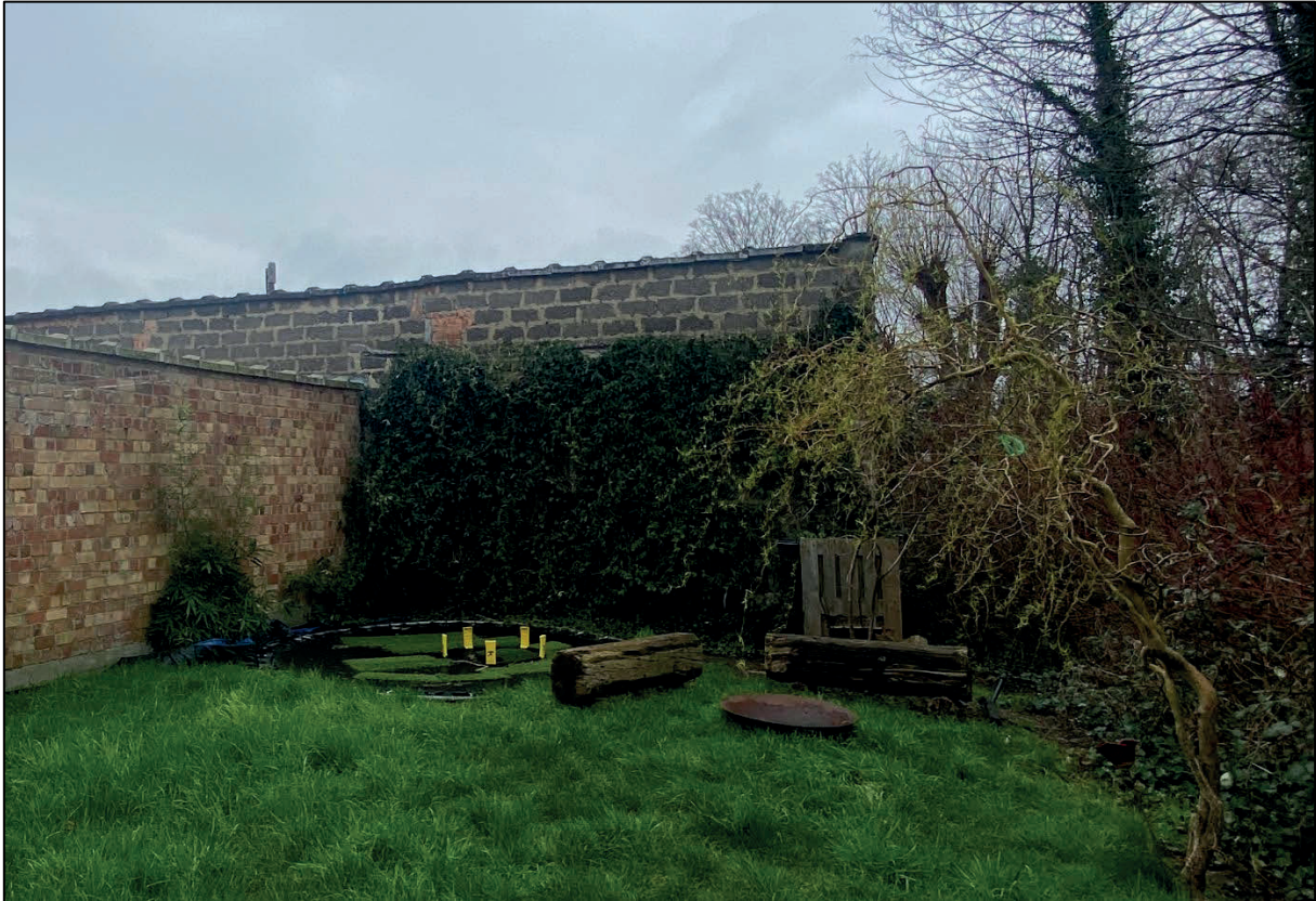
Figuur 10: Het niet-gemene muurdeel in grijze baksteen en deels begroeid

Het muurdeel van de loods op perceel 326 N6 dat grenst aan perceel 326 D6 wordt niet beschouwd als een gemene muur. Het betreft een steunmuur waarop een trellis voor klimplanten is bevestigd. Ondanks het feit dat de muur ook in gebruik is aan de zijde van perceel 326 N6, beschouwt dit voorstel van afpaling de muur als niet-mandelig op basis van een andersluidende titel, namelijk het PV van meting. Bij het overbrengen van de afstanden uit het PV van meting op de feitelijke toestand blijkt immers dat het muurdeel volledig is opgetrokken op perceel 326 N6.