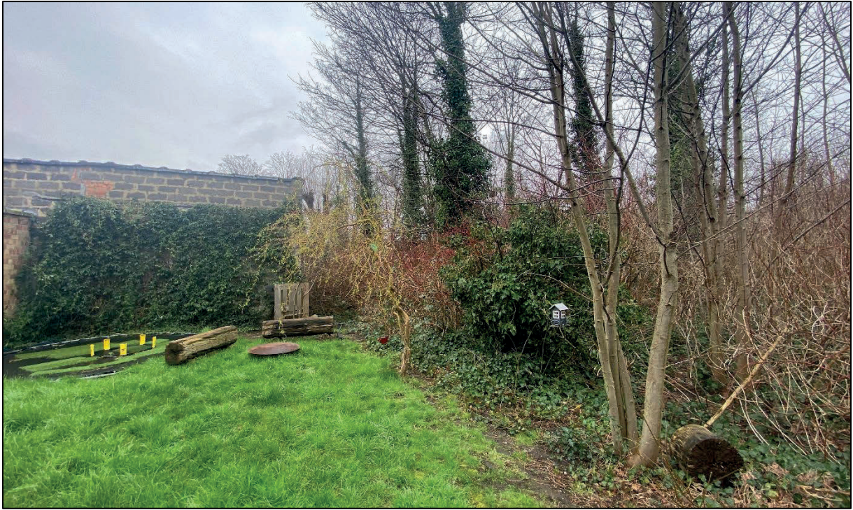
Figuur 8: Hoekpunt D valt samen met rechterhoek van de loods achteraan, links het niet-gematerialiseerde grensdeel met het perceel 314 R

vastgestelde perceelsgrens en is bijgevolg te beschouwen als een gemene afsluiting. Het deel palend aan perceel 314 R is niet gematerialiseerd.