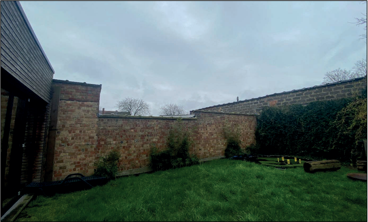
Figuur 12: gemene muur in bruine baksteen