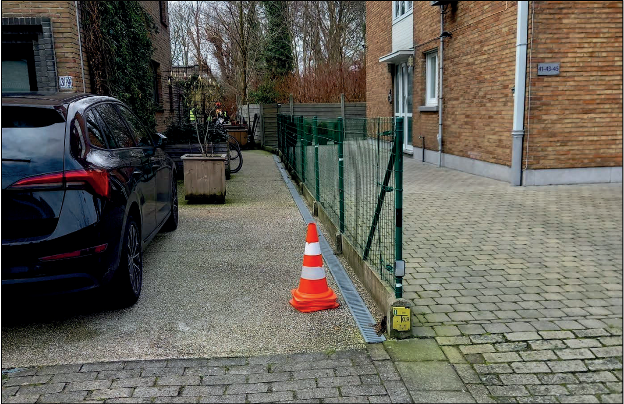
Figuur 6: de groene draadafsluiting materialiseert grensdeel B-C