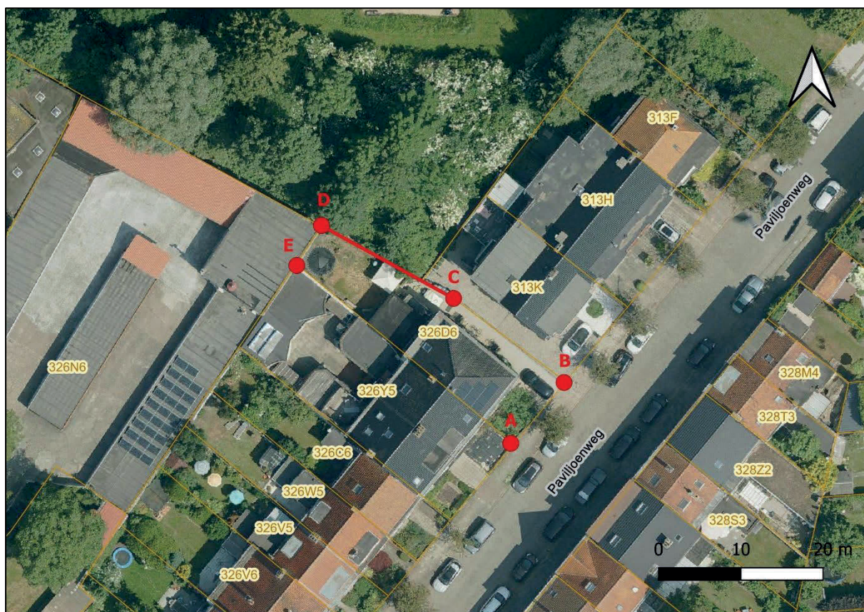
Figuur 7: situering grensdeel C-D

Het PV van meting vermeldt een afstand van 20,90 meter tussen hoekpunt C en D. De feitelijke afstand tussen hoekpunt C en de hoek van de achterliggende loods op perceel 326 N6 bedraagt 20,94 meter.