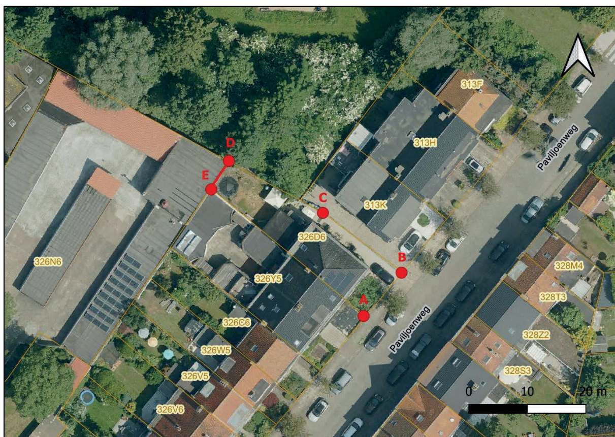
Figuur 9: situering grensdeel D-E

Hoekpunt E wordt beschouwd als de kruising van de as doorheen het midden van een bestaand muurdeel aanpalend aan het perceel 326 Y5 en de bouwlijn van de loods op perceel 326 N6. De feitelijke afstand zoals gemeten tussen dit hoekpunt E en hoekpunt D (hoek loods: zie paragraaf 4.3) is 5,70 meter.