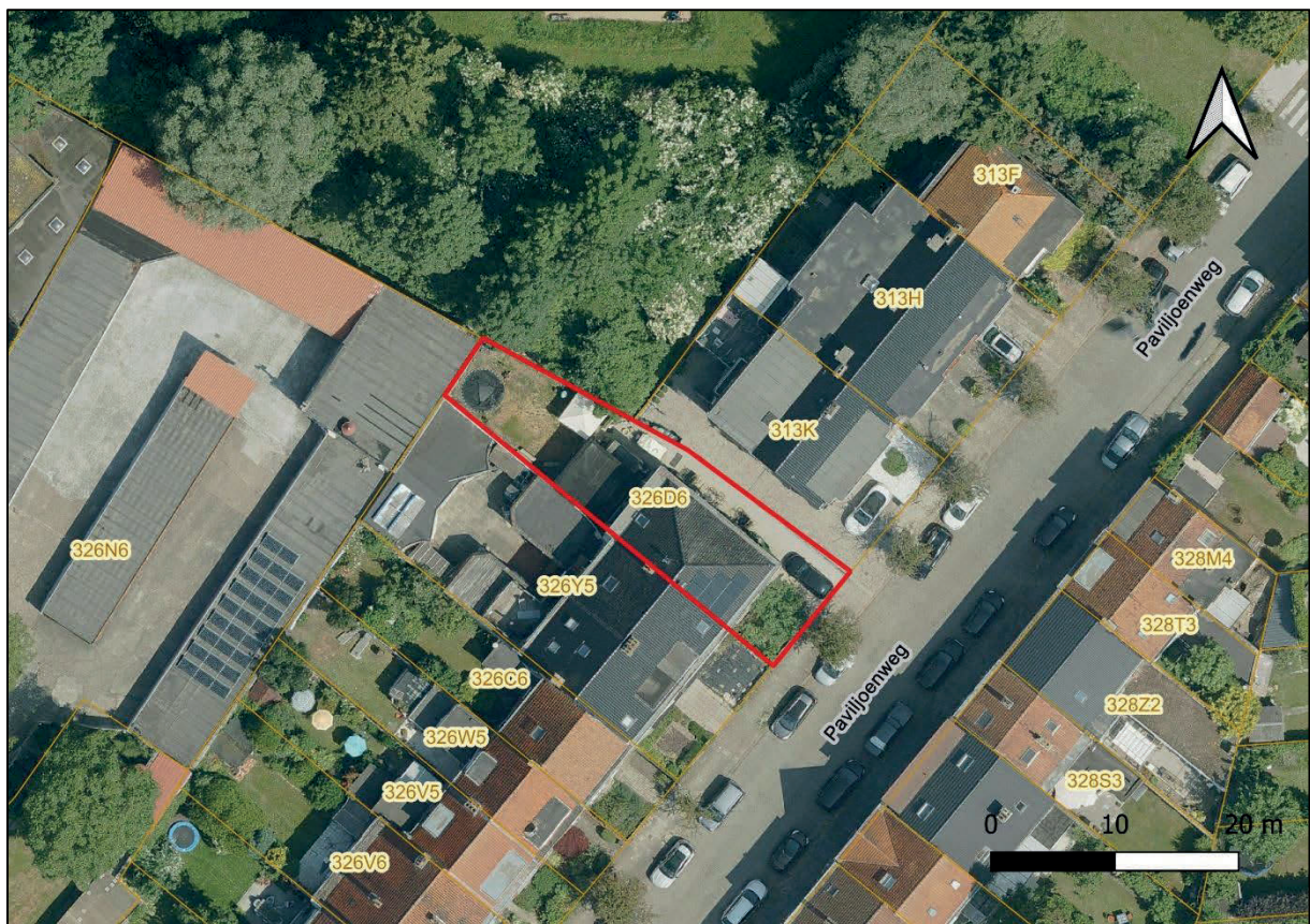
Figuur 1: Situering perceel 326 D6

Perceel 326 D6 bestaat uit een voortuinstrook, een halfopen bebouwing en een tuinzone.