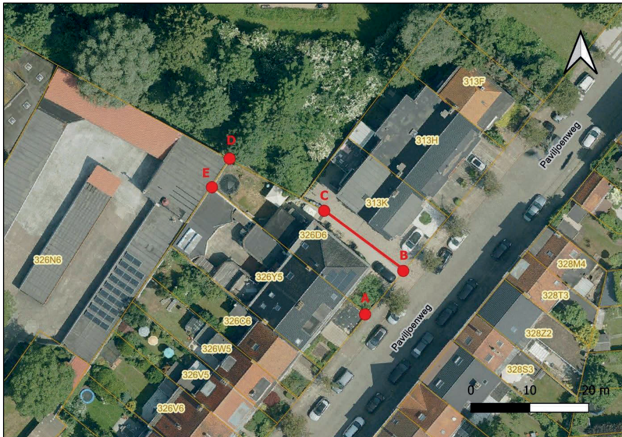
Figuur 5: Situering grensdeel B-C

De afstand van 14,20 meter zoals vermeld op het PV van meting is overgenomen als de afstand tussen de hoekpunten B en C. De richting van het grensdeel volgt ook uit het PV van meting. Daardoor is meteen de ligging van hoekpunt C bepaald.