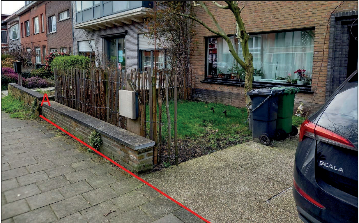
Figuur 3: De rooilijn is gematerialiseerd door de voorzijde van het tuinmuurtje en de scheiding van de verharding

is de juridische breedte van de Paviljoenweg ter hoogte van het betrokken perceel 14,20 meter. De bestaande indiciën van de rooilijn, met name een lage tuinmuur en de rand van de verharding wijken maximaal 2 centimeter af van de juridische breedte van de weg. De afwijking wordt als verwaarloosbaar beschouwd. De richting van het grensdeel AB valt dus samen met de bestaande toestand, met name de voorzijde van de tuinmuur en de scheiding van de verharding van de oprit van het perceel met de verharding van de stoep (zie afbeelding 1).