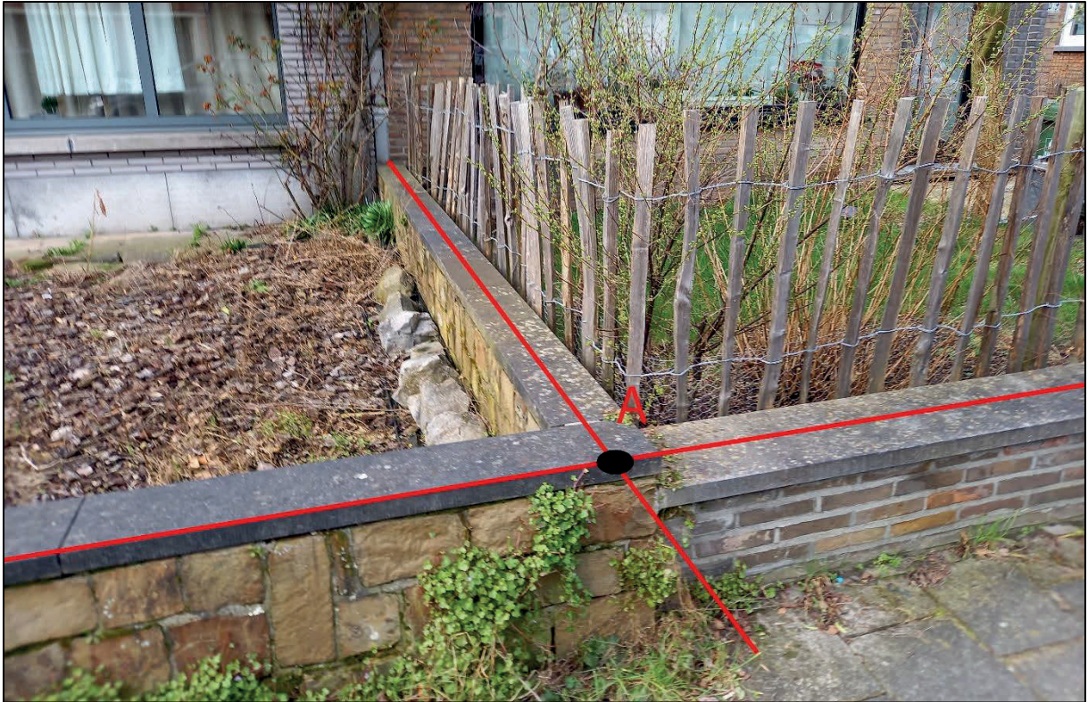
Figuur 4: de ligging van hoekpunt A

Deze scheidingsmuur tussen de voortuinen wordt als een gemene muur beschouwd op basis van een bijzonder voorwaarde in de akte van verkoop (p.4):